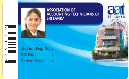
(AAT மாணவர் அடையாள அட்டை மாதிரி உருவம்)

மாணவர்கள் தமது முழுமையான கையொப்பத்தினையும் சுருக்கக்கையொப்பத்தினையும் வேறாகும் வகையில் தெளிவாகப் பயன்படுத்த வேண்டுமென்ப பொதுவாக எதிர்பார்க்கப்படுகின்றது.