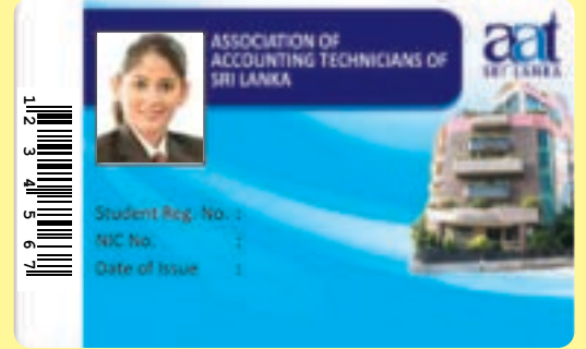
(AAT மாணவர் அடையாள அட்டை மாதிரி உருவம்)

மாணவர்கள் தமது முழுமையான கையொப்பத்தினையும் சுருக்கக்கையொப்பத்தினையும் வேறாகும் வகையில் தெளிவாகப் பயன்படுத்த வேண்டுமென்ப பொதுவாக எதிர்பார்க்கப்படுகின்றது.